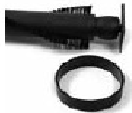
Cinghia Piatta Flat Belt