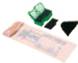
Set filtrante Filter Set